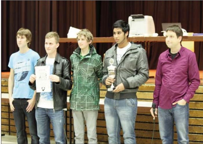
Die Sieger der WK I die Schüler des Illtalgymnasiums