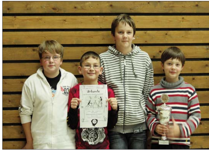
Die Sieger der WK IV (links) und der Grundschulen (rechts)